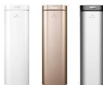
美的白 土豪金 钛金灰