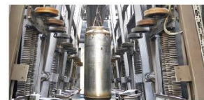
喷砂机 引用德国一流设备，实现全自动化作业