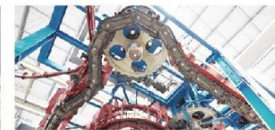
积放链系统 先进的输送链系统，稳定可靠